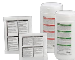
Ontkalkingmiddel en koffieaanslag oplosmiddel

Ideaal om thermoskannen en moeilijk bereikbare plekken te reinigen.